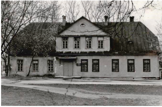
1 paveikslas. Buvusios 1-osios pradinės mokyklos pastatas A. Smetonos g., XX a. 10 deš. (VRVA, F. 1019, ap. 12, b. 15038, l. 15)

Figure 1. Former building of the 1st primary school in A. Smetonos st, 1930s (VRVA, F. 1019, o. 12, e. 15038, l. 15)