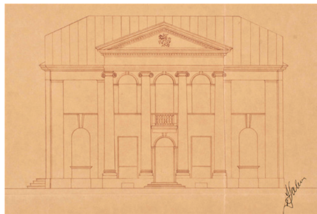
4 paveikslas. Neįgyvendintas pradinės mokyklos projektas, 1929 m.