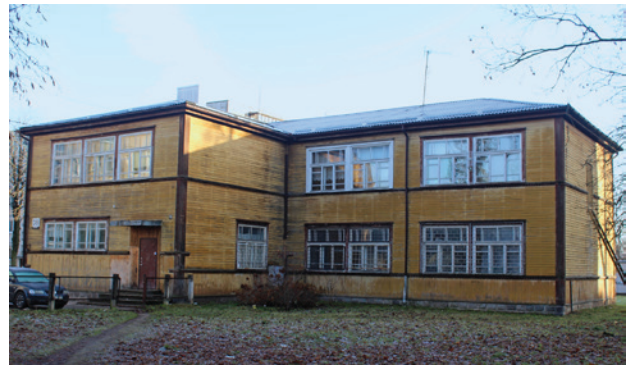
6 paveikslas. Buvusios 4-osios pradinės mokyklos pastatas Nevėžio g., 2017 m.

Pastato raiškoje atsiskyta iki tol Panevėžio mokyklų architektūroje dominavusių istorinių architektūrinių formų detalių. Tą išreiškia supaprastinta, mažai stilistinių bruožų turinti architektūra. Be to, atsiskaidoma iki tol miesto švietimų įstaigose dominavusios simetrinės plano kompozicijos su centriniu įėjimu. Šio pastato planas yra netaisyklingos „L“ raidės formos su kampe įkomponuotu įėjimu. Kita savybė, iliustruojanti nutolimą nuo tradicijos, yra akivaizdi langų kompozicijoje – dviejų aukštų pastato išorę skaido suporintos plačios langų ertmės, tik su nedideliais kontrastingų spalvų intarpais skaidančios beveik ištisą tūrį.