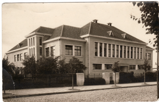
7 paveikslas. Buvusios 3-iosios pradinės mokyklos pastatas Ukmergės g., XX a. 4 deš. (Panevėžio kraštotyros muziejus, PKM.15607.F.3225)