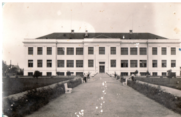
5 paveikslas. Buvusi mergaičių gimnazija Smėlynės g. 1932 m. (Panevėžio kraštotyros muziejus, PKM.15590. F. 3244)

Pastato architektūroje dominuoja istoristinei architektūrai giminingi bruožai – simetrinė kompozicija, dekoro elementai – fasadą skaido puskolonės, stilizuoti piliastrai, akcentuotas centrinis įėjimas – savybės, kurias galima sieti ne su naujų architektūrinių formų paieška. Bet šio fakto nereikėtų traktuoti kaip bylojusio apie architektūrinį atsilikimą nuo bendrų to meto Lietuvos tendencijų. Net ir