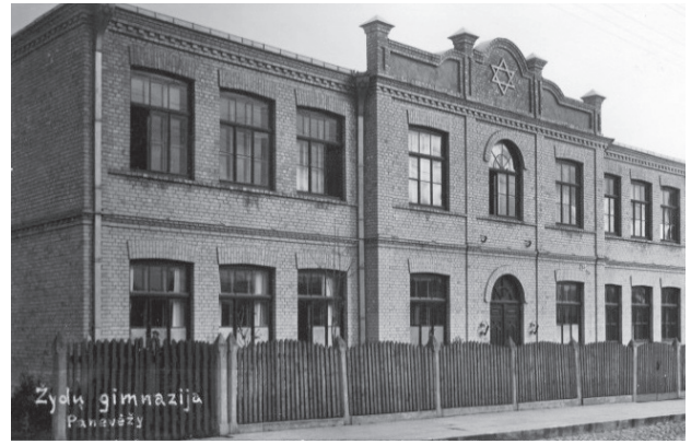
2 paveikslas. Buvusios žydų gimnazijos pastatas Elektros g., XX a. 4 deš.

Figure 1. Former building of the 1st primary school in A. Smetonos st, 1930s