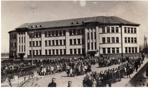
9 paveikslas. Buvusios 2-osios pradinės mokyklos pastatas Liepų al., XX a. 5 deš.