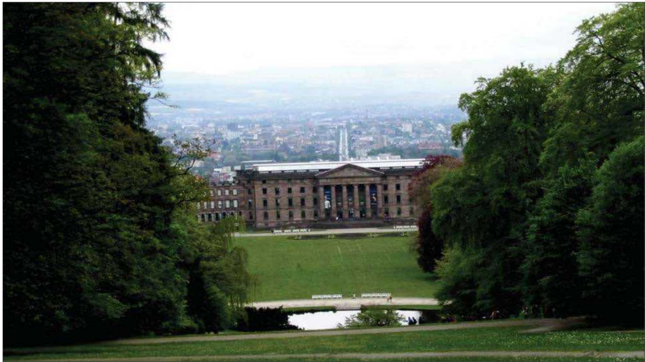
2 pav. Buvusi dvaro sodyba – potencialus visuomenės traukos centras, sudarantis sąlygas miestovaizdžio apžvalgai. Kaselis (Vokietija)