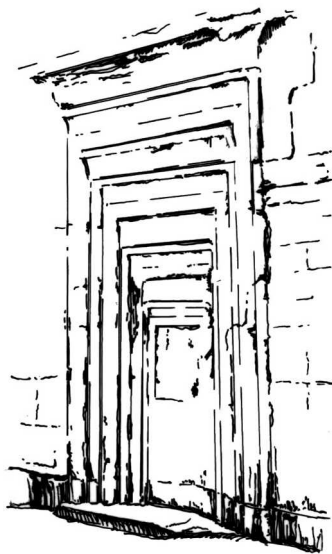
2 pav. „Netikrosios durys“ Karnake, Egipte, XIII a. pr. m. e. Fig 2 “False Door” in Karnak, Egypt, the 13th century BC

nes tikėta, kad dvasinė mirusiojo esybė Ka 5 gali vaikščioti pro duris, jų neatverdama. Dažniausiai Ka durys būdavo daromos iš monolitinio kalkakmenio, nudažyto raudonai ir išmarginto juodais taškais (imituojant granitą) [11]; daug rečiau pasitaiko medinės ar tiesiog sienos plokštumoje išpieštos durys 6 . Analogiškų simbolinės-memorialinės paskirties durų aptinkama Anatolijoje (jos datuojamos XVI–XIV a. pr. m. e.) [12].