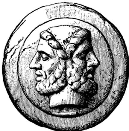
3 pav. Romos imperijos moneta su dviveidžio Jano atvaizdu, apie 225–212 m. pr. m. e.