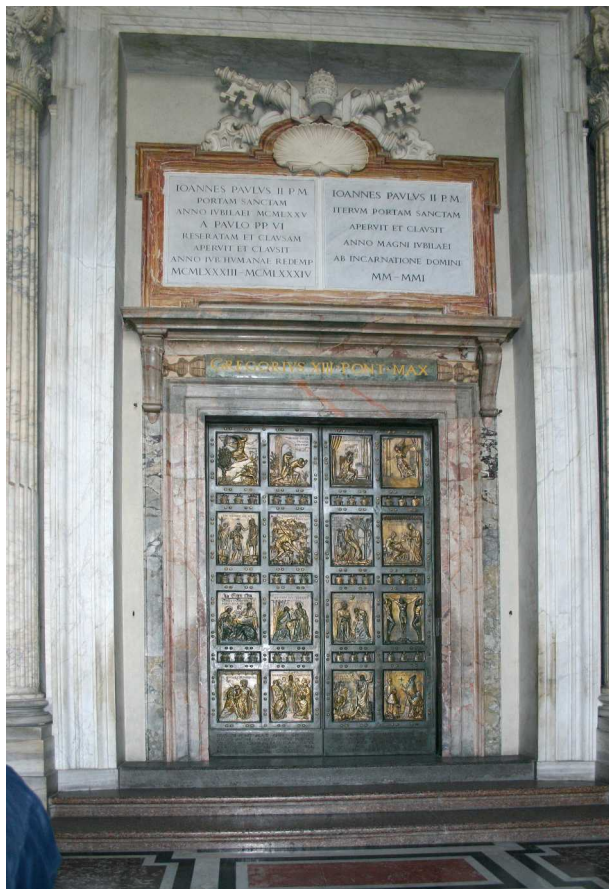
5 pav. Šventosios durys Šv. Petro bazilikoje Vatikane, aut. V. Consorti, 1949 m. Fig 5. "Sacred Door" in St Peter's Basilica in Rome, 1949, author V. Consorti

Krikščioniškoje durų simbolikoje itin svarbi spalva. Raudonų durų tradicija įsigalėjo ir išsiskleidė viduramžiais – tuo metu raudonai buvo dažomos pietinės, šiaurinės ir vakarinės bažnyčių durys. Tai simbolizavo Kristaus aukos kraują ir kryžiaus ženklą (durų išdėstymas bažnyčios plane) – Tėvas, Sūnus ir Šventoji Dvasia. Taip pastatui suteikiamas šventovės statusas, bažnyčia suvokiama kaip saugi vieta, prieglauda nuo fizinio ir dvasinio pavojaus, nes raudonos durys nepraleidžia blogio 26 .