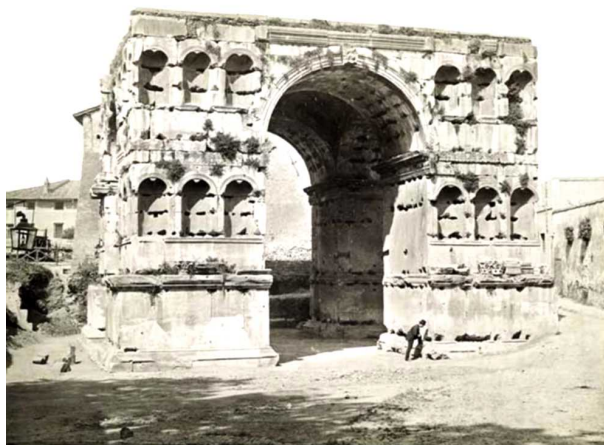
4 pav. Keturveidžio Jano arka Romoje, statyta apie IV a.