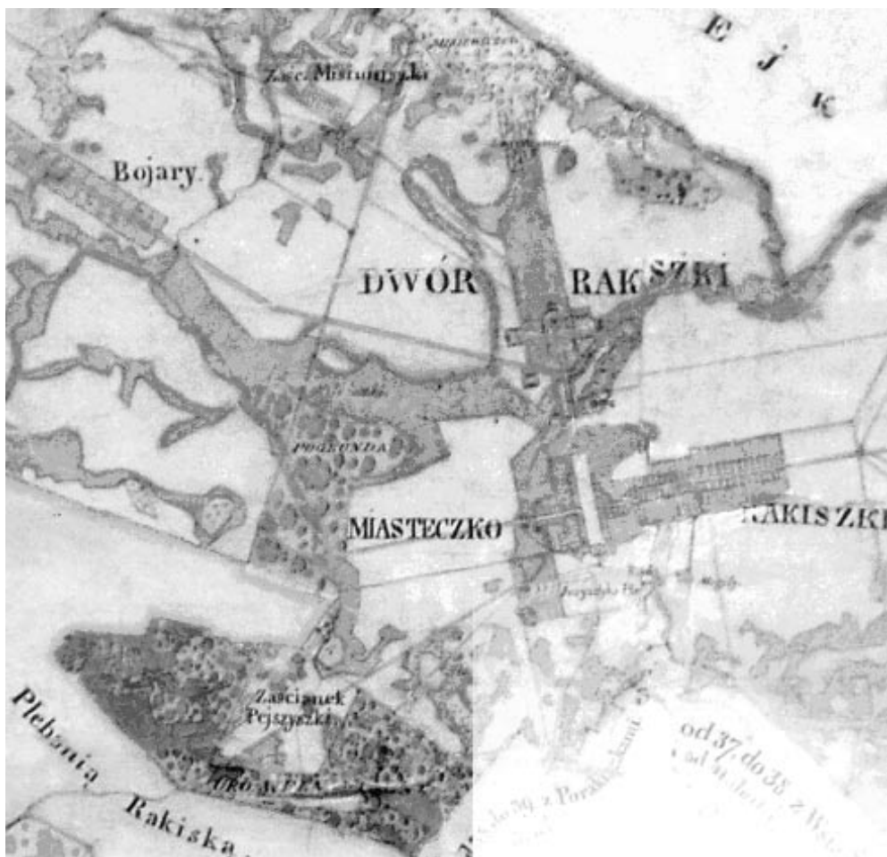
2 pav. Rokiškio grafystės žemėlapiu dalis (M 1: 27 000 sumažintas 10 kartų) ir žemėlapiu centro fragmentas

2. Litviniškių ir Skrebiškių žemėlapių sudarytojas juose savo pavardės neįrašė. Kadangi šie žemėlapiai sudaryti tais pačiais metais, ir jų atlikimo stilius analogiškas puošyba, žemėlapiu sudedamųjų dalių išdėstymu ir net iš esmės tapačiais titulais, galima teigti ir apie tą patį autorių. Rokiškio grafystės žemėlapiu sudarytojas savo vardą ir pavardę įsirašė žemėlapiu titule kaip ir Pakruojo bei Šeduvos dvarų žemių planų sudarytojas.